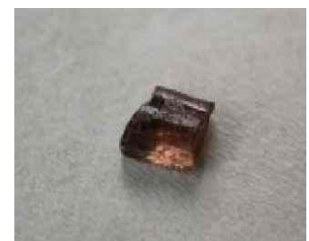
Abbildung 15: Pinit

Zwischen dem Bergmassiv des Himalaja und der Hochebene befindet sich ein Gürtel, angefüllt mit praktisch Allen Mineralien und Edelsteinen.