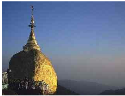
Abbildung 17: Golden Rock