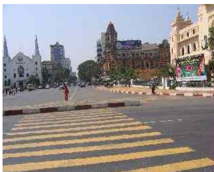
Abbildung 7: Strassenverkehr Hauptstrasse Rangun

In der ehemaligen Hauptstadt Rangun sind KEINE Motorräder zugelassen.