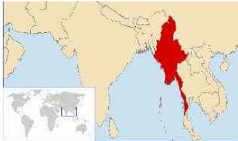
Abbildung 1: Geografische Lag von Burma

Es gliedert sich in sieben States und sieben Divisions .