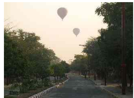
Abbildung 9: Verkehr in BAGAN