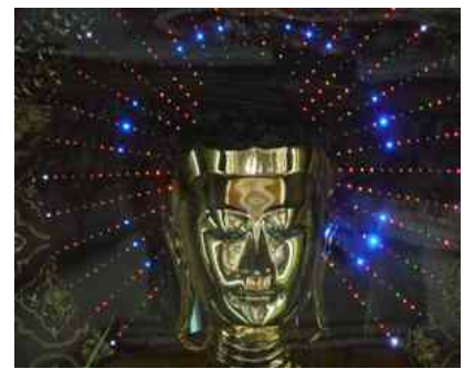
Abbildung 18: Golden Buddha

Zudem fördert Myanmar täglich etwa 12.000 Barrel Erdöl sowie fünf Millionen Kubikmeter Erdgas. Die Ausbeutung und Weiterverarbeitung wird einerseits von der staatlichen Ölgesellschaft MOGE vorgenommen und andererseits von ausländischen Ölkonzernen Total baut mit Unocal eine Gaspipeline von Myanmar nach Thailand. Zwei Milliarden Dollar sollen dafür veranschlagt sein