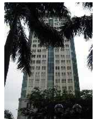
Abbildung 6: Das weiterhin unbenutzt und leer stehende SAKURA Geschäfts Center

Beide Flüsse entspringen im Südosten des Himalaja, der Volksrepublik China