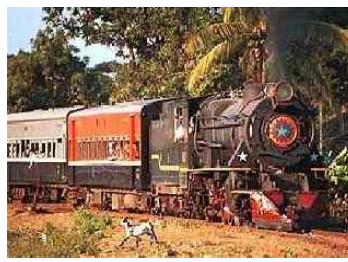
Abbildung 11: Nostalgische Reise im Dampfzug