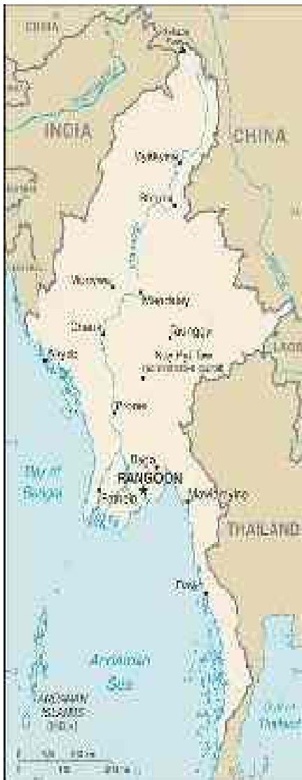
Abbildung 4: Städte und Flüsse