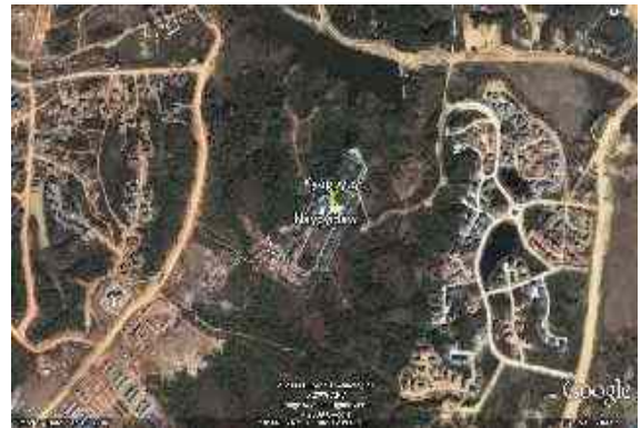
Abbildung 22: Verloren in der Einsamkeit

Im November 2005 begann die Regierung mit der Verlegung des Regierungssitzes von Rangun nach Kyappay (Heimstadt der Könige) in der Nähe der Stadt Pyinmana (Mandalay-Division)