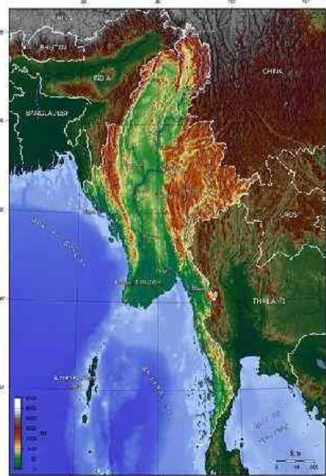
Abbildung 2: Landkarte Burma