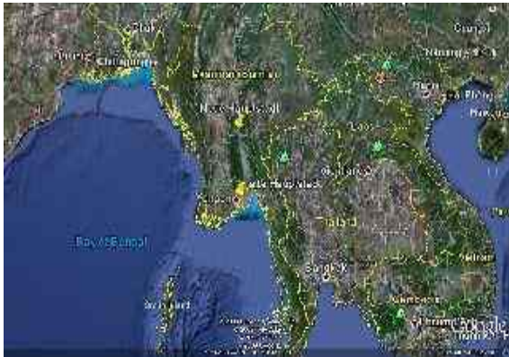
Abbildung 20: Lage der neue Hauptstadt

Nach dem Seebeben im Indischen Ozean 2004 am 26. Dezember und der hierdurch ausgelösten Flutwelle verhinderte das Regime internationalen Hilfskräften die Einreise und stellte so niedrige Zahlen über die Opfer zur Verfügung.