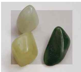
Abbildung 13: Jade