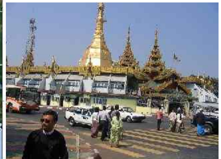
Abbildung 5: Der goldene Tempel in Rangun