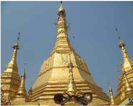
Abbildung 16: Der Goldene Tempel

Gold wird ebenfalls gewaschen, wobei eine beträchtliche Menge davon von Pilgern in Form von hauchdünnen Blättchen auf Zedis (Stupas), Buddha-Statuen und den Goldenen Felsen geklebt wird.