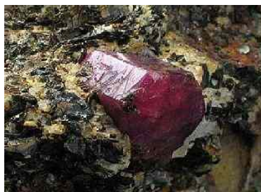
Abbildung 14: Rubin