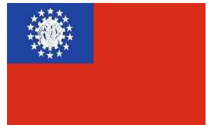
Abbildung 3: Landesflagge