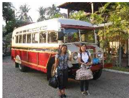
Abbildung 8: Besondere Ehre ! Ein Chevrolet Bus 1948