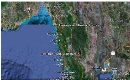
Abbildung 10: Touristen Attraktion Piuntaza – Makdauk

Diese Strecke erlangte die durch den Film Die Brücke am Kwai (200 Meter lang) grosse Berühmtheit. Diese wurde aber bereits kurz nach Ende des Krieges demontiert.