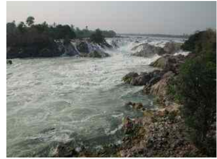
Khon Phapeng Wasserfälle