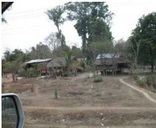
Wohnen auf dem Land